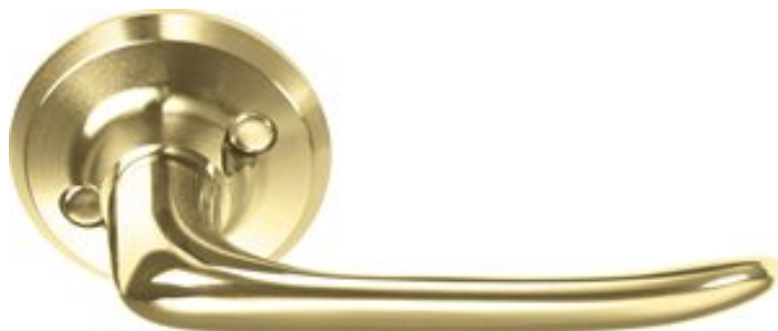
Assa trycke 6696 med returfjäder i mattborstad mässing.